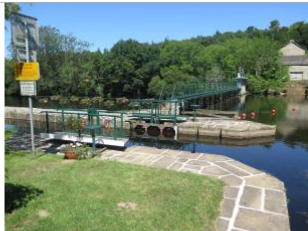
Amont de l'écluse n°18 de Sainte-Barbe à Baud en juillet 2022