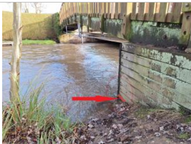
Laisse de crue à 86 cm/haut tablier passerelle.

NIVELLEMENT DU SPC/SACN. LE SPC N'EST PAS GÉOMÈTRE EXPERT, LES COTES SONT DONNÉES À TITRE INDICATIF. - 14/02/2025