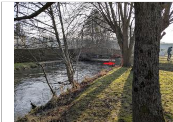
Vue depuis la berge amont, rive droite.