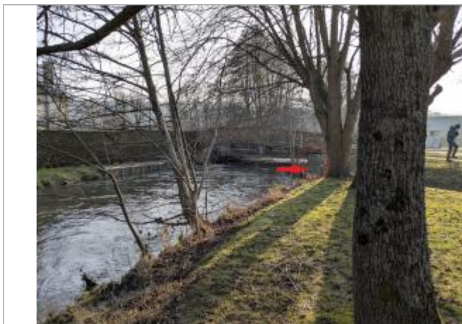
Vue depuis la berge amont, rive droite.