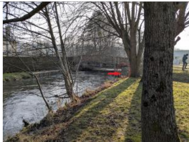
Vue depuis la berge amont, rive droite.