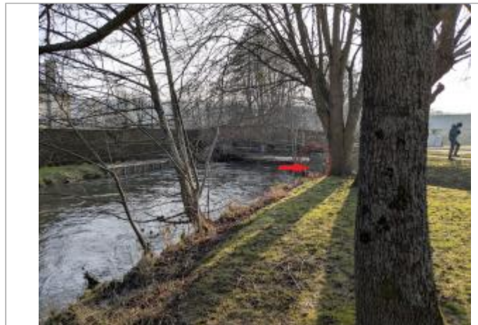
Vue depuis la berge amont, rive droite.

Coordonnées WGS84 : X: 1.37407812 / Y: 49.41469300