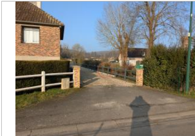
Vue depuis la rue des Pâtures