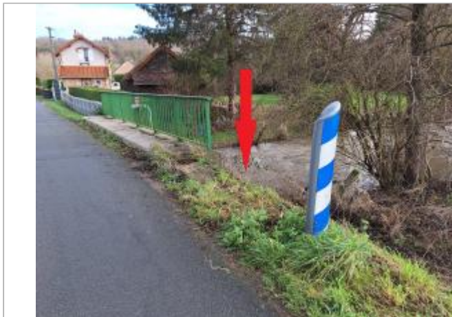
Vue depuis la rue de l'Andelle