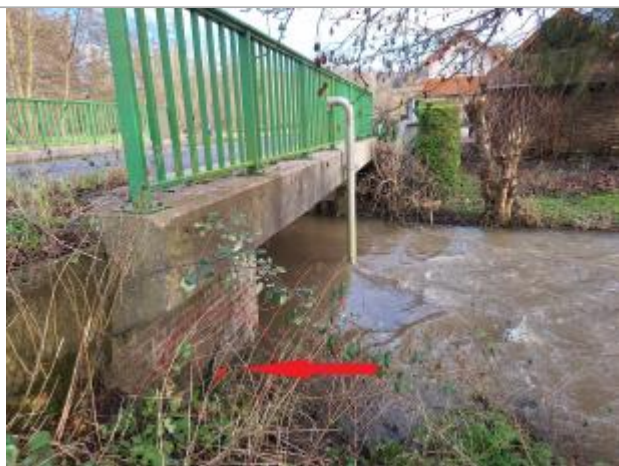
Laisse de crue à 1.52 m du haut du tablier du pont.

NIVELLEMENT DU SPC/SACN. LE SPC N'EST PAS GÉOMÈTRE EXPERT, LES COTES SONT DONNÉES À TITRE INDICATIF. - 14/02/2025