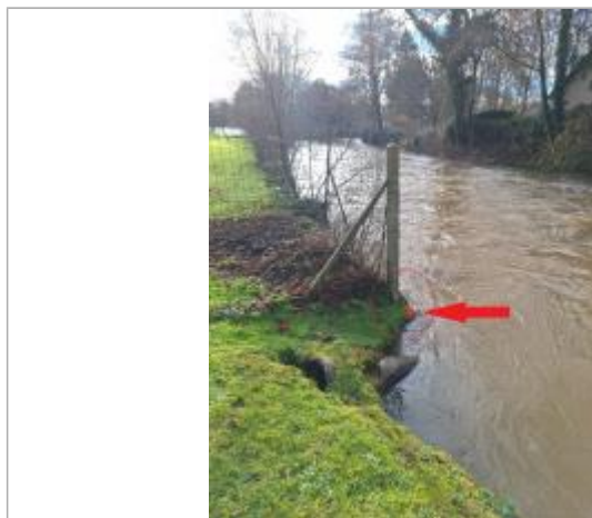
Laisse de crue au pied du poteau.

NIVELLEMENT DU SPC/SACN. LE SPC N'EST PAS GÉOMÈTRE EXPERT, LES COTES SONT DONNÉES À TITRE INDICATIF. - 14/02/2025