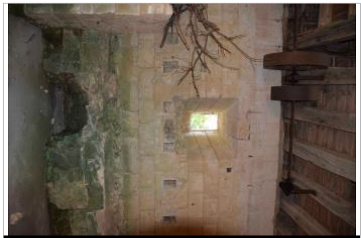
Vue du mur intérieure du moulin, face à la porte

MARQUE Texte : 8BRE 1896 Maximum de l'inondation : Oui