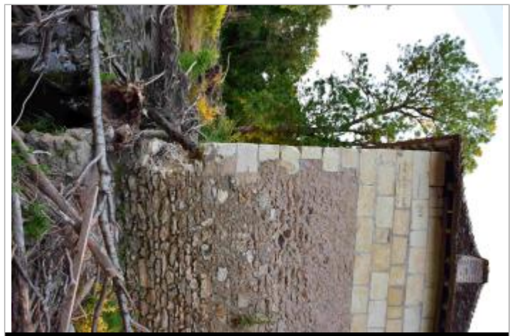
Moulin face Nord

MARQUE Texte : 1982 Maximum de l'inondation : Oui Visibilité : Oui