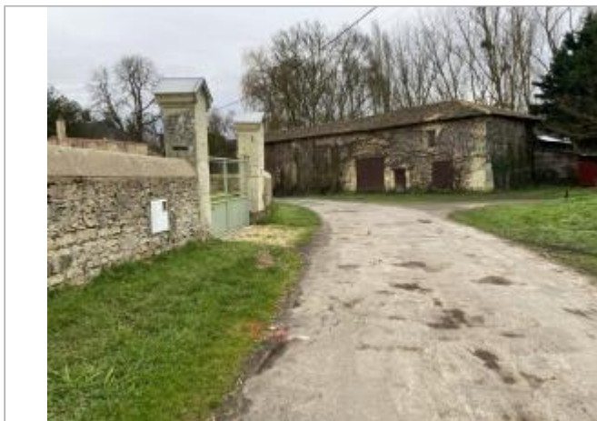
Vue du site - auteur : AGERIN

Coordonnées WGS84 : X: -0.21735520 / Y: 47.07638840