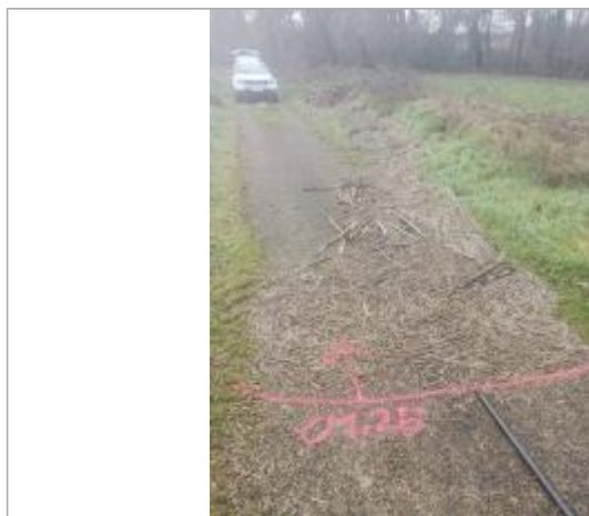
Vue du repère - auteur : AGERIN