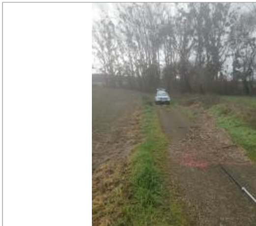
Vue du site - auteur : AGERIN