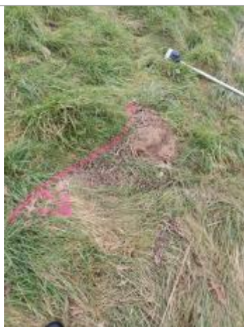
Vue du repère - auteur : AGERIN