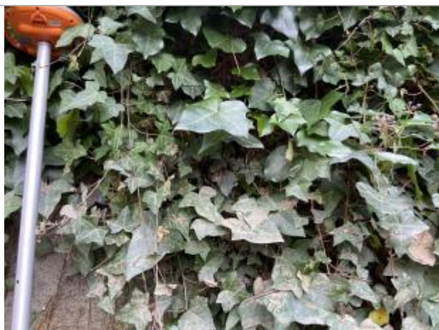
Vue du repère - auteur : AGERIN