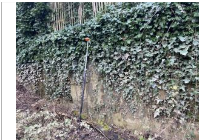
Vue du site - auteur : AGERIN

Coordonnées WGS84 : X: -0.08779040 / Y: 47.24432380