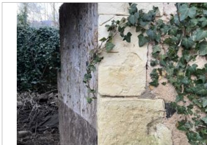
Vue du repère - auteur : AGERIN