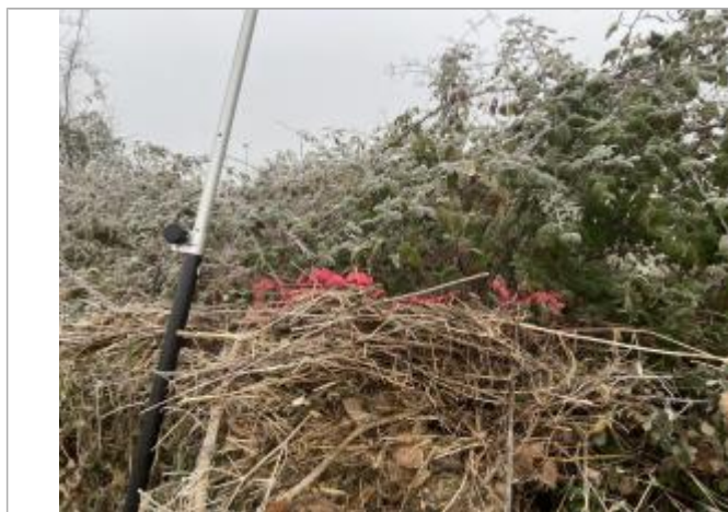
Vue du repère - auteur : AGERIN