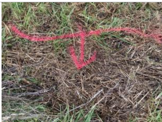
Vue du repère - auteur : AGERIN