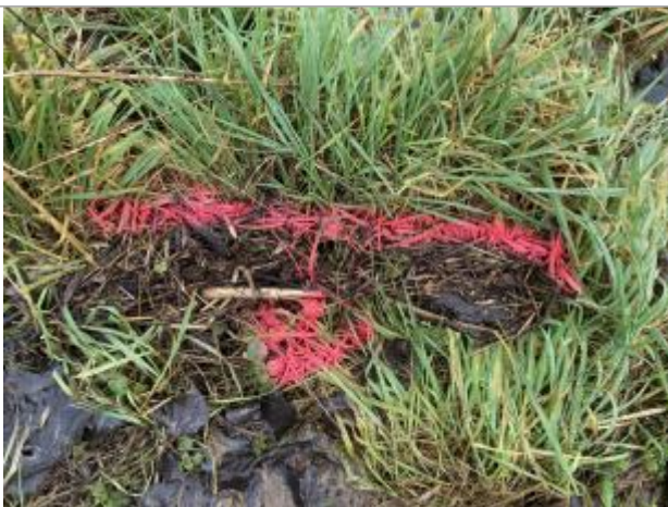
Vue du repère - auteur : AGERIN