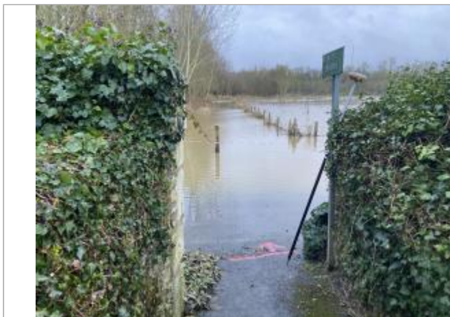
Vue du site - auteur : AGERIN

Coordonnées WGS84 : X: -0.14795490 / Y: 47.14172050