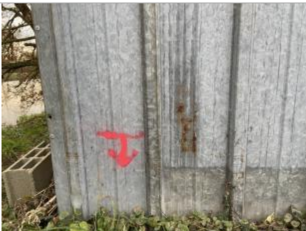
Vue du repère - auteur : AGERIN

Altitude calculée de l'eau (en m) : 39.402