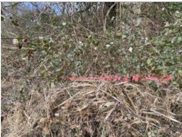
Vue du repère - auteur : AGERIN

Altitude calculée de l'eau (en m) : 45.556