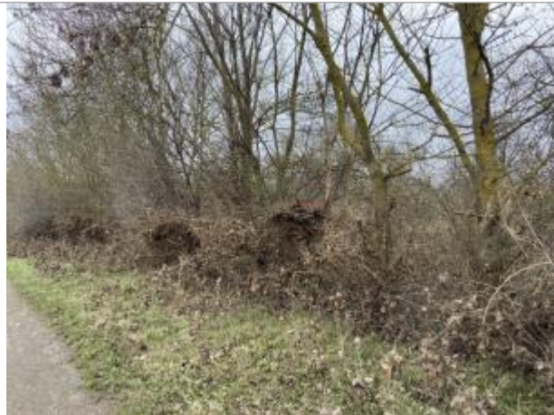
Vue du site - auteur : AGERIN

Coordonnées WGS84 : X: -0.09431340 / Y: 47.26240470