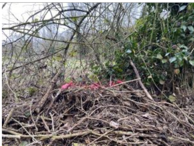
Vue du repère - auteur : AGERIN