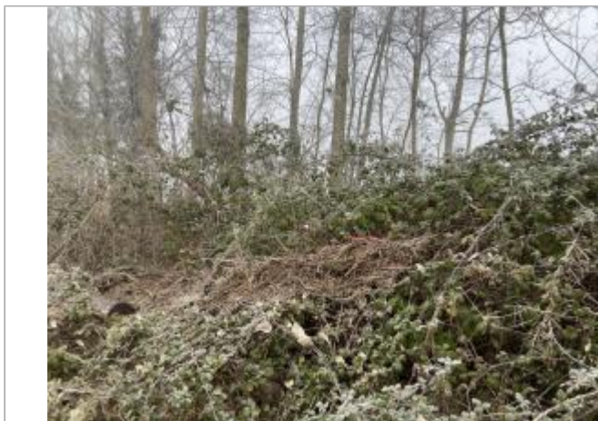
Vue du site - auteur : AGERIN

Coordonnées WGS84 : X: -0.16821280 / Y: 46.94828650