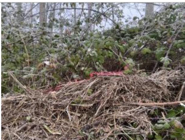
Vue du repère - auteur : AGERIN