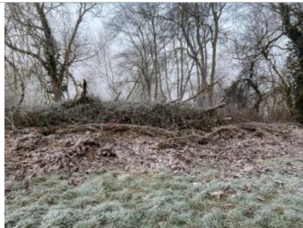
Vue du site - auteur : AGERIN