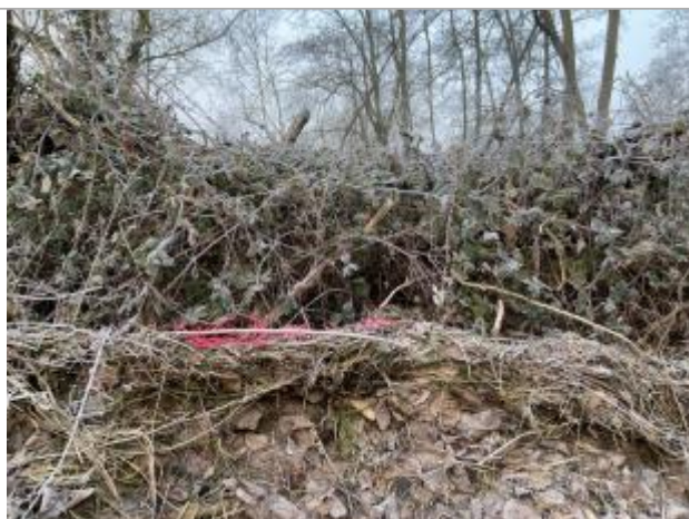
Vue du repère - auteur : AGERIN