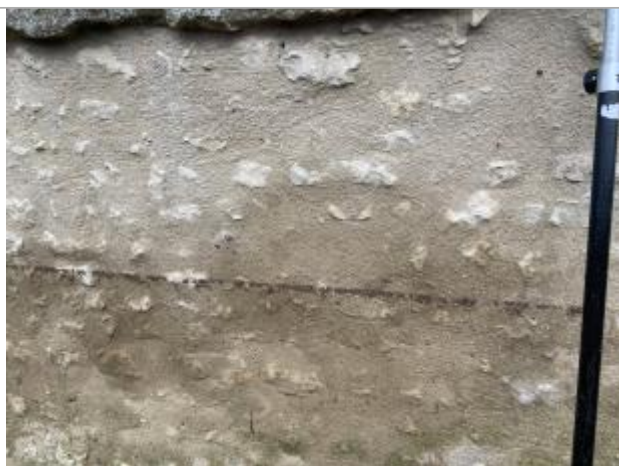
Vue du repère - auteur : AGERIN