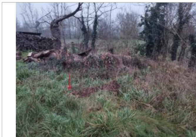
Vue du repère - auteur : AGERIN

Altitude calculée de l'eau (en m) : 65.7