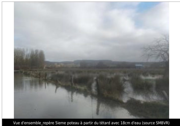
Vue d'ensemble_repère 5ieme poteau à partir du têtard avec 18cm d'eau