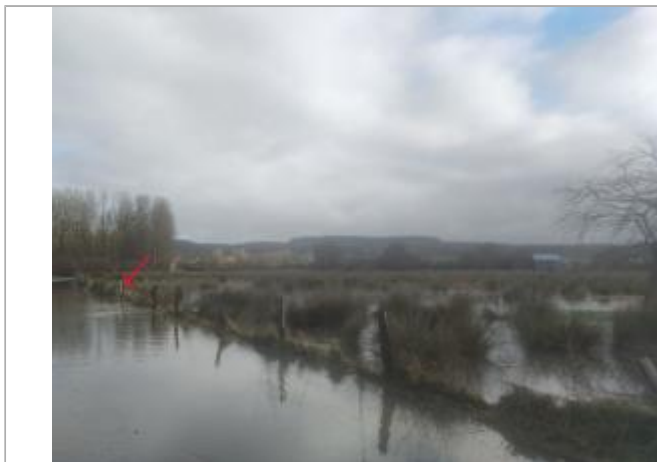
Vue d'ensemble_site_route des ponts gras

Coordonnées WGS84 : X: 0.59483077 / Y: 49.32746400