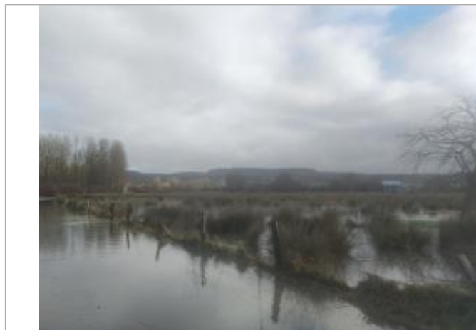
Vue d'ensemble_repère 5ieme poteau à partir du têtard avec 18cm d'eau

NIVELLEMENT SPC SACN. LE SPC N'EST PAS GÉOMÈTRE EXPERT, LES COTES SONT DONNÉES À TITRE INDICATIF. - 10/07/2025