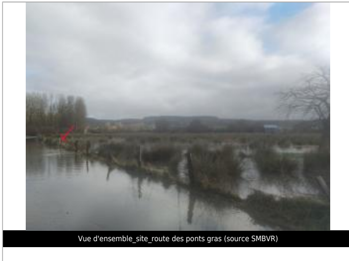
Vue d'ensemble_site_route des ponts gras