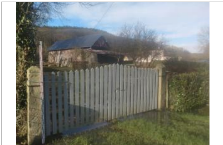
Vue d'ensemble de la pile de la barrière

NIVELLEMENT SPC SACN. LE SPC N'EST PAS GÉOMÈTRE EXPERT, LES COTES SONT DONNÉES À TITRE INDICATIF. - 16/05/2025