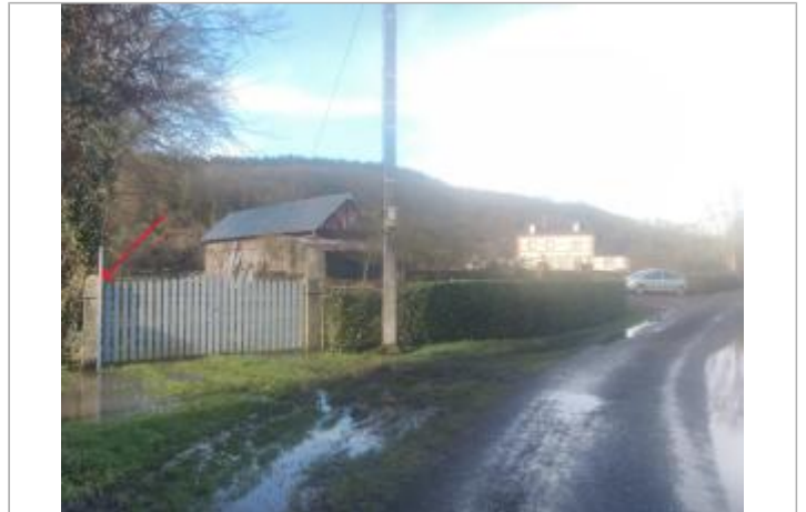
Vue d'ensemble entrée secondaire 6 rue d'Oc à Brionne

Coordonnées WGS84 : X: 0.71721725 / Y: 49.17979880