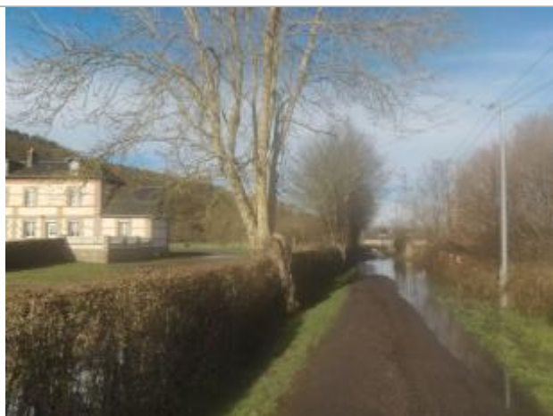
Vue d'ensemble - poteau edf à droite de la photo

NIVELLEMENT SPC SACN. LE SPC N'EST PAS GÉOMÈTRE EXPERT, LES COTES SONT DONNÉES À TITRE INDICATIF. - 16/05/2025