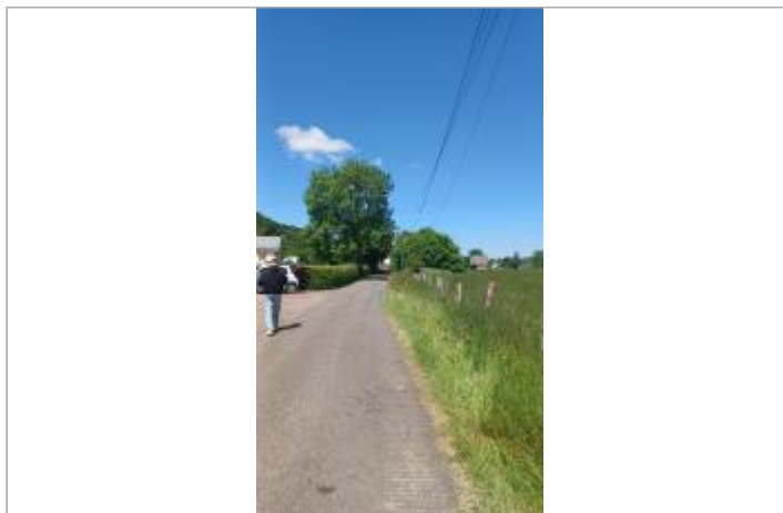
Vue depuis la rue d'Oc.

Coordonnées WGS84 : X: 0.71696696 / Y: 49.18049140