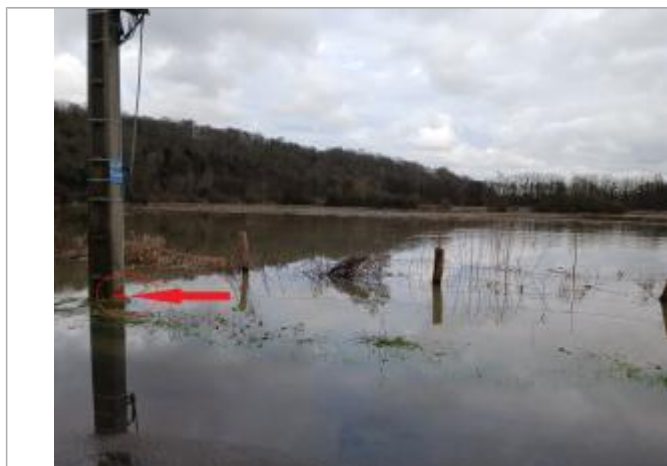
Laisse de crue à 22.5 cm/sol.