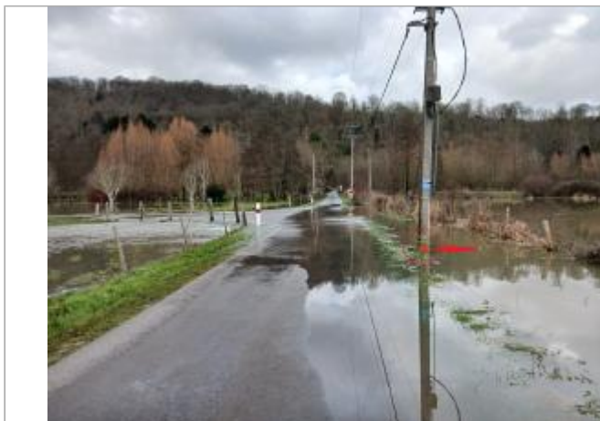
Vue depuis la RD 714

Coordonnées WGS84 : X: 1.30843609 / Y: 49.34788680