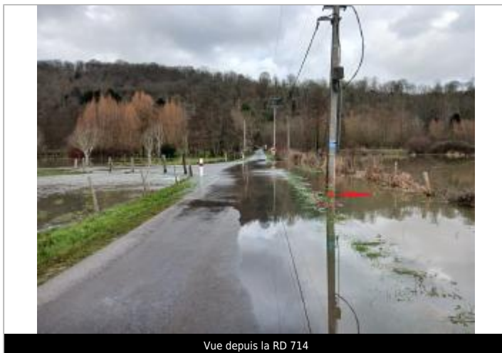
Vue depuis la RD 714