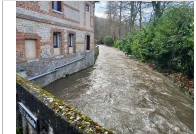
vue depuis le pont du chemin du Pouchet.