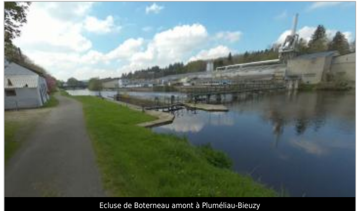
Ecluse de Boterneau amont à Pluméliau-Bieuzy

Coordonnées WGS84 : X: -3.06419687 / Y: 47.94942060