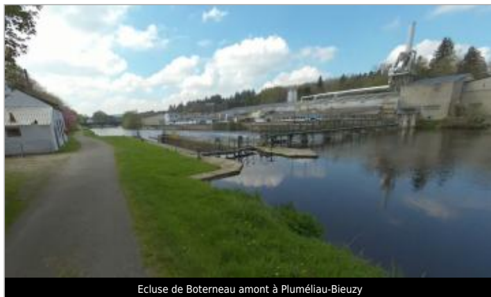
Ecluse de Boterneau amont à Plumélieu-Bieuzy