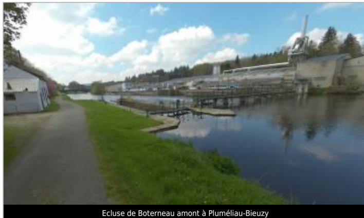
Ecluse de Boterneau amont à Pluméliau-Bieuzy

Coordonnées WGS84 : X: -3.06419687 / Y: 47.94942060