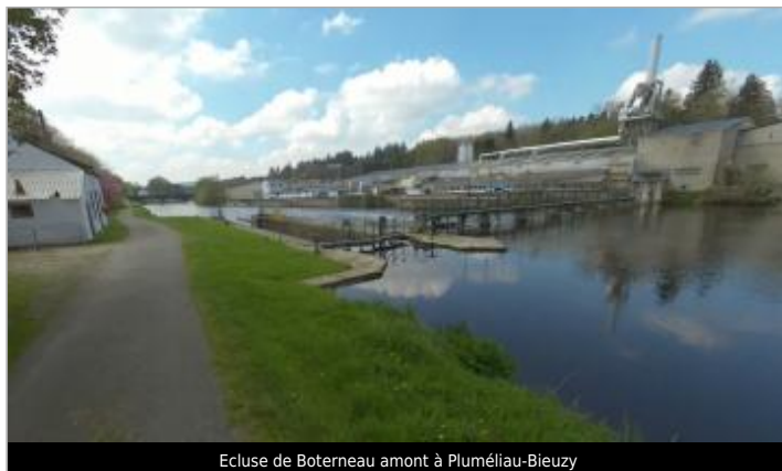
Ecluse de Boterneau amont à Pluméliau-Bieuzy

Coordonnées WGS84 : X: -3.06419687 / Y: 47.94942060