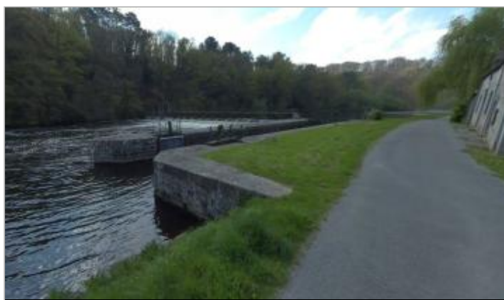
Echelle aval (disparue) de l'écluse de La Couarde

GÉOLOCALISATION Coordonnées WGS84 : X: -3.04354814 / Y: 47.97546320 Coordonnées RGF93 (Lambert 93) X: 249506.11 / Y: 6781145.27 Coordonnées RGF93 (ETRS89) : X: -3.0435481 / Y: 47.9754632 Code Hydro: J5--0210 Rive de référence: Gauche