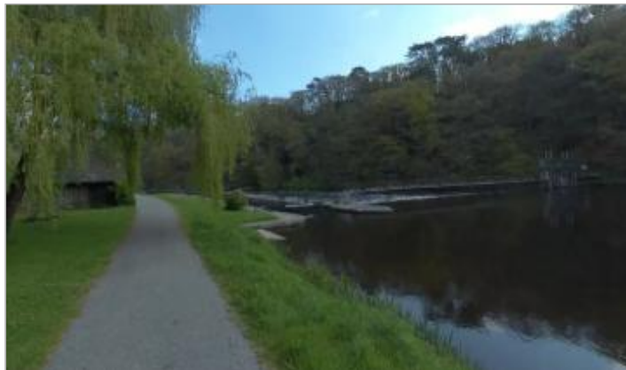
Echelle amont (disparue) de l'écluse de La Couarde