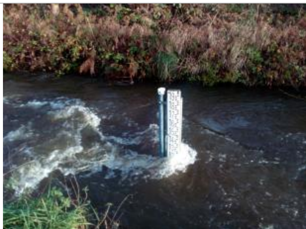
Echelle limnimétrique du Guyoult à Epiniac - Baguer-Pican

Altitude calculée de l'eau (en m) : 17.312 m