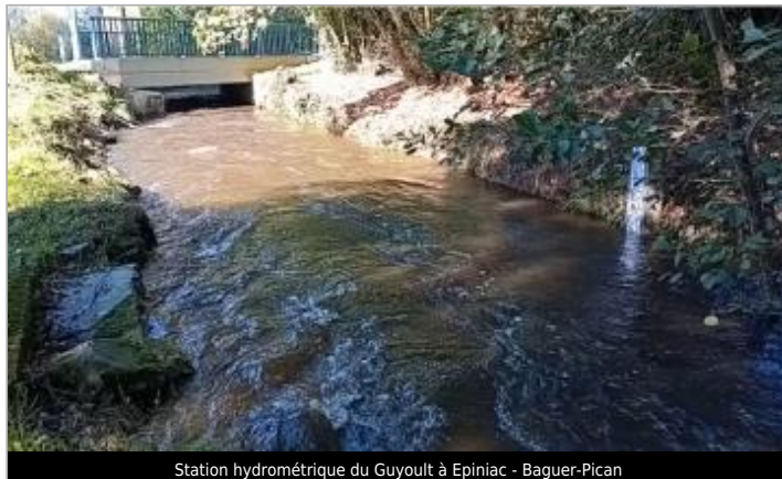
Station hydrométrique du Guyoult à Epiniac - Baguer-Pican