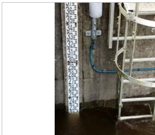
Echelle limnimétrique de la station de la Claie à Bohal - Saint-Marcel

Altitude calculée de l'eau (en m) : 17.979 m