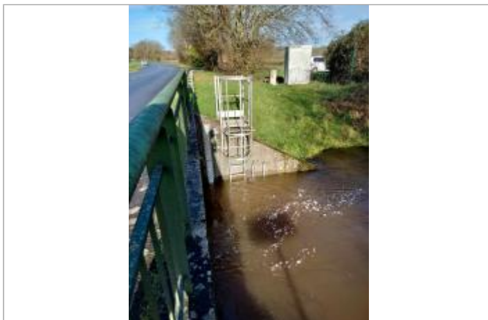
Station de la Claie à Bohal - Saint-Marcel lors de la crue de janvier 2025