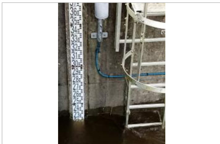
Echelle limnimétrique de la station de la Claie à Bohal - Saint-Marcel

Altitude calculée de l'eau (en m) : 17.979 m