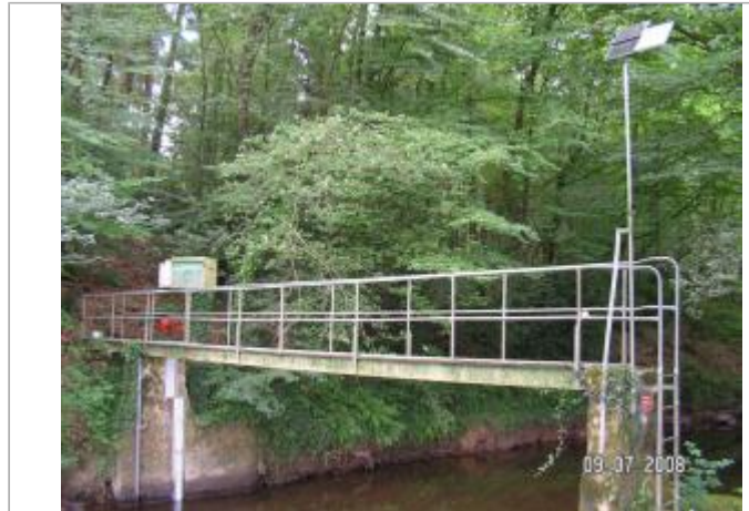
Station hydrométrique de l'Aff à Quelneuc