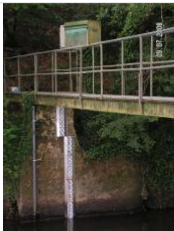
Echelle limnimétrique de l'Aff à Quelneuc

Altitude calculée de l'eau (en m) : 15.339 m