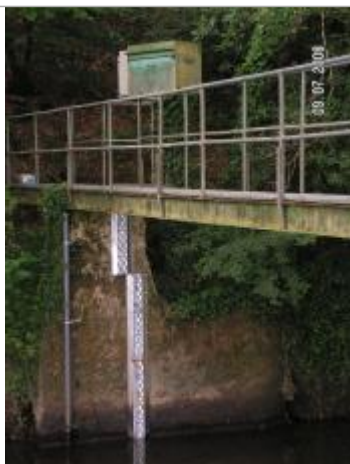
Echelle limnimétrique de l'Aff à Quelneuc

Altitude calculée de l'eau (en m) : 15.379 m