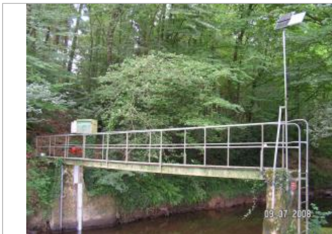
Station hydrométrique de l'Aff à Quelneuc