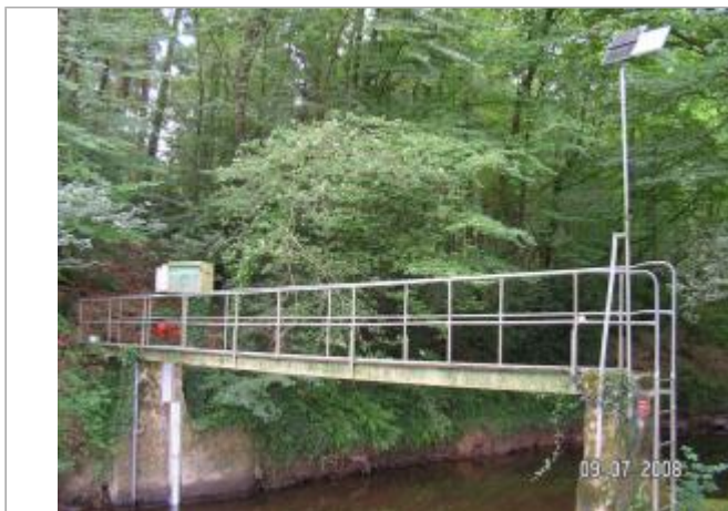
Station hydrométrique de l'Aff à Quelneuc

Coordonnées WGS84 : X: -2.07479395 / Y: 47.82927220