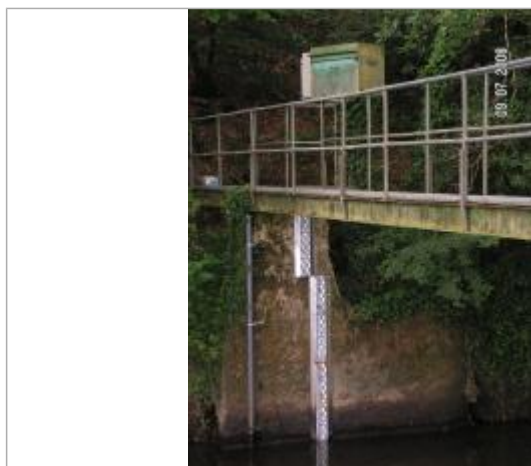
Echelle limnimétrique de l'Aff à Quelneuc

Altitude calculée de l'eau (en m) : 15.549 m