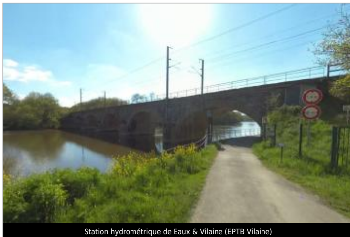
Station hydrométrique de Eaux & Vilaine (EPTB Vilaine)