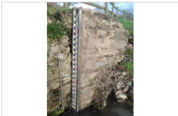
Echelle de la station hydrométrique de Eaux & Vilaine (EPTB Vilaine)

Altitude calculée de l'eau (en m) : 5.88 m