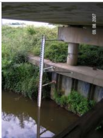
Echelle limnimétrique de la Chère

Altitude calculée de l'eau (en m) : 10.82 m