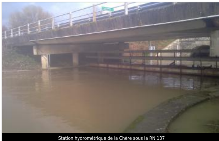
Station hydrométrique de la Chère sous la RN 137

Coordonnées WGS84 : X: -1.70353693 / Y: 47.70050720