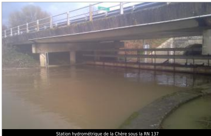
Station hydrométrique de la Chère sous la RN 137