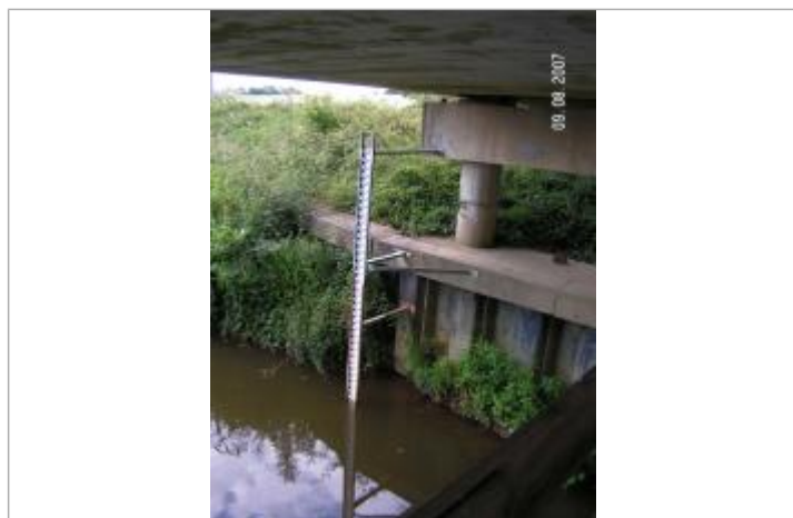
Echelle limnimétrique de la Chère

Altitude calculée de l'eau (en m) : 10.94 m