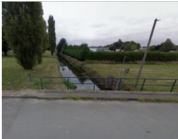
Station hydrométrique de la Chère à Chateaubriant

Coordonnées WGS84 : X: -1.38865657 / Y: 47.71905730