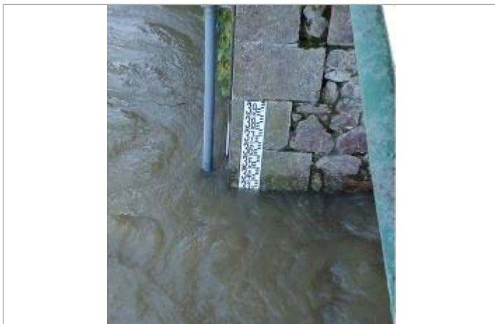
Echelle limnimétrique du Semnon à Bain de Bretagne

Altitude calculée de l'eau (en m) : 25.288 m