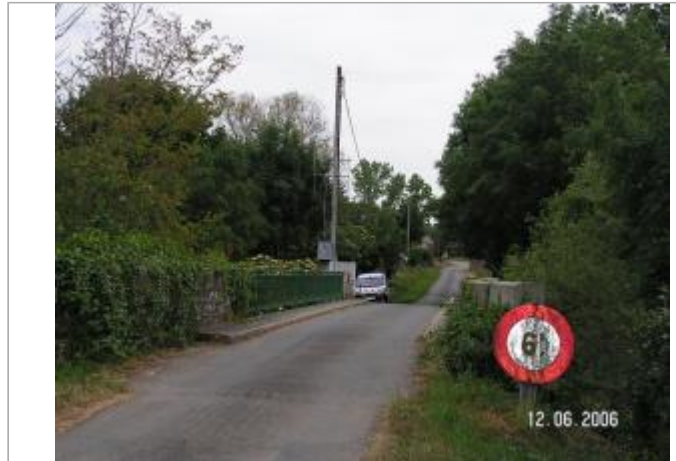
Station limnimétrique du Semnon à Bain de Bretagne en 2006