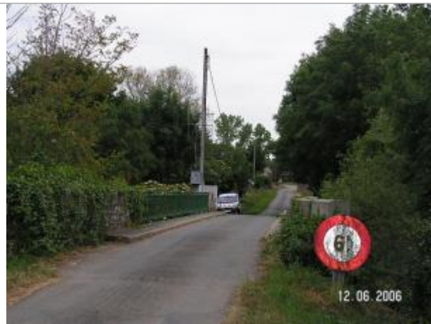
Station limnimétrique du Semnon à Bain de Bretagne en 2006