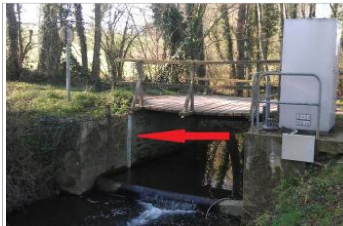
Station limnimétrique du Canut nord à Maxent

Coordonnées WGS84 : X: -1.99344530 / Y: 47.99548900