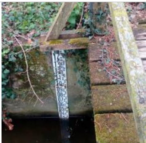
Echelle limnimétrique de la station du Canut nord à Maxent

Altitude calculée de l'eau (en m) : 91.17 m