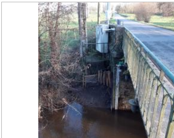
Station Vigicrues de la Flume à Pacé

Coordonnées WGS84 : X: -1.77973412 / Y: 48.18085480