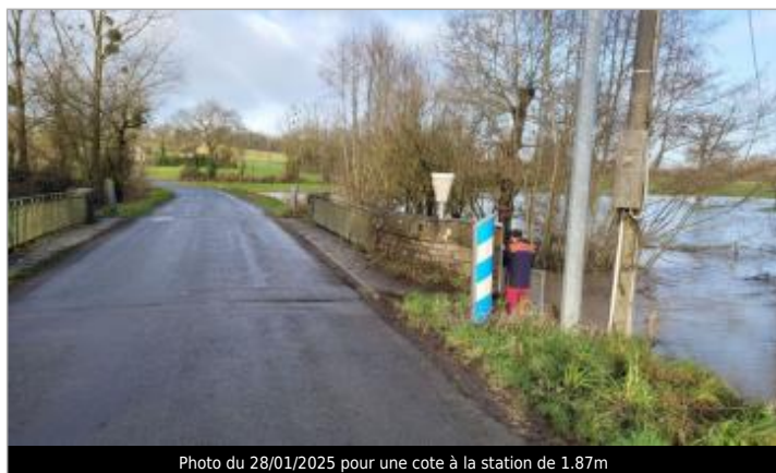
Photo du 28/01/2025 pour une cote à la station de 1.87m