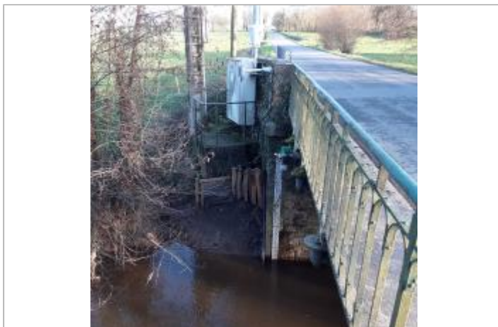
Station Vigicrues de la Flume à Pacé