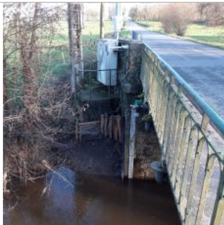
Station Vigicrues de la Flume à Pacé